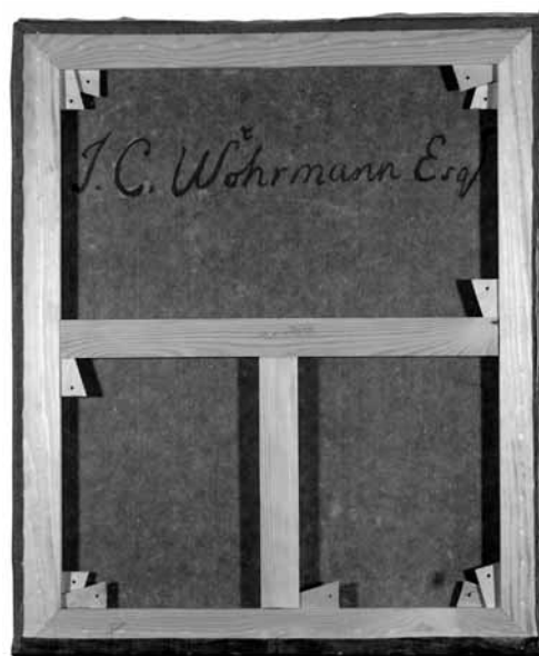
I. C. Wöhrmann. Švč. Mergelė Marija. Drobė, aliejus; 62,5 x 74,6 cm; XVIII a. pabaiga. Nugarinė pusė po restauravimo

Nuėmus paveikslą nuo porėmio, nustačius jo užterštumą mikro-organizmais, dezinfekuota nugarinė paveikslų pusė. Kieta, praradusi elastingumą, pagrindo drobė buvo elastinga laikant paveikslą virš glicerino, vandens, spirito tirpalu suvilgytų popieriaus lakštų. Tapybos sluoksnis tvirtintas baltyminių klijais užklijuojant profi-laktinį popierių. Figūriniai išplyšimai suklijuoti Plextol B 500 klijais, užpildant skylę lino plaušu. Paveikslų drobė sutvirtinta užklijuojant mikalentinį popierių Kluce! G tirpalu, pagamintu dėl per žemo drobės pH su kalcio bikarbonato tirpalu, sudarant šarminį rezervą. Darbą sunkino užrašai nugarinėje pusėje, todėl prieš dubliavimą jie buvo