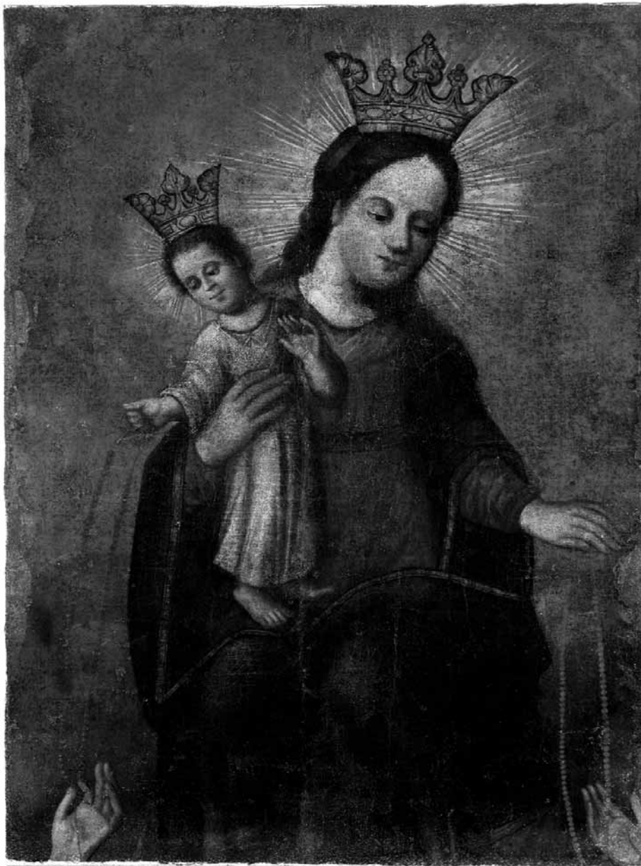
Nežinomas XVIII a. tapytojas. Švč. Mergelė Marija su kūdikiu. Drobė, aliejus; metalo aptaisai, 80,5 x 60 cm. Po restauravimo

gruntuotos restauraciniu gruntu ir pradėti valyti tapybos sluoksnio paviršiniai nešvarumai šilto distiliuoto vandens tamponėliais. Iš tapybos faktūros įlinkių nešvarumai išvalyti skalpeliu. Gruntuotos vietos retušuotos akvarele, taškiniu būdu. Restauruoto paveikslo paviršius padengtas damaros lako sluoksniu.