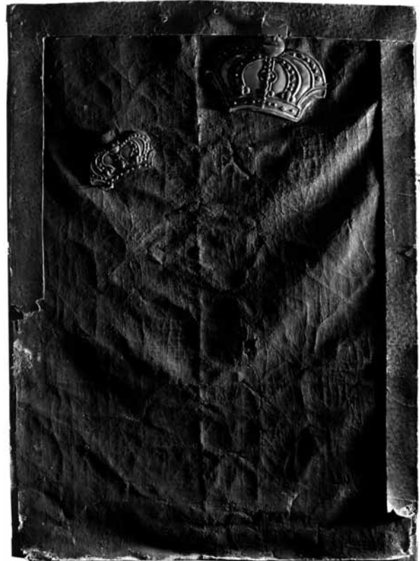
Nežinomas XVIII a. tapytojas. Švč. Mergelė Marija su kūdikiu. Drobė, aliejus; metalo aptaisai, 80,5 x 60 cm. Prieš restauravimą