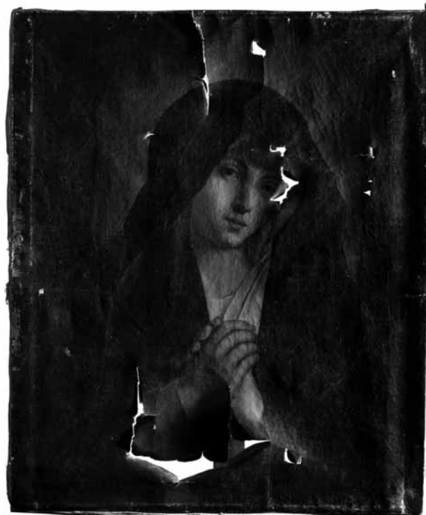
I. C. Wöchrmann. Švč. Mergelė Marija. Drobė, aliejus; 62,5 x 74,6 cm; XVIII a. pabaiga. Prieš restauravimą

The article presents paintings distinguished by their history and restoration methods which were restored by the graduates, Bachelor's Degree holders in restoration of Vilnius Academy of Fine Arts. The diploma works were done in 2008. Restoration of paintings from the collection of the Samogitian museum "Alka" was done in Pranas Gudynas restoration centre of the Lithuanian Art Museum.