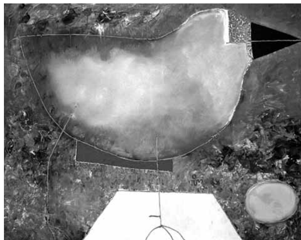
Romualdas Inčirauskas. Žemaičių pergalė ties Janydziais. 2009 m. Drobė, aliejus. ŽDM