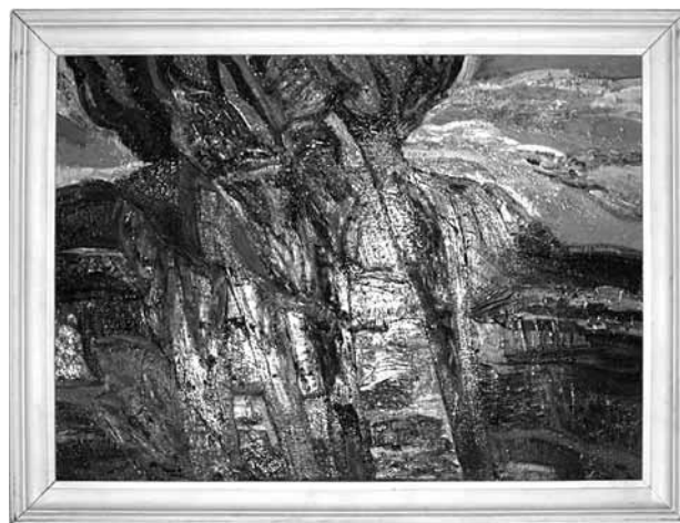
Leonardas Tuleikis. Ruduo prie upės. 1997m. Drobė, aliejus. ŽDM