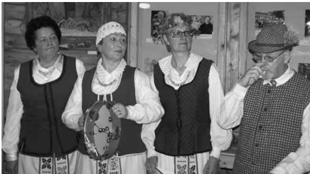
Koncertuoja liaudiškos muzikos ansamblio „Smagumėlis“ dalyviai iš Panevėžio rajono Dembavos kaimo Adomo Petrausko muziejuje Uoginių kaime.