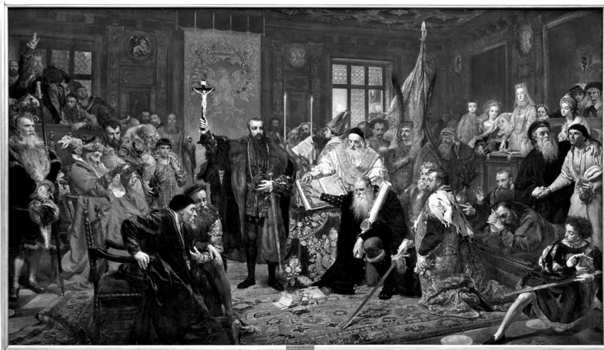
Janas Mateika. „Liublino unija“. 1869. Drobė, aliejus. 298 x 512 cm