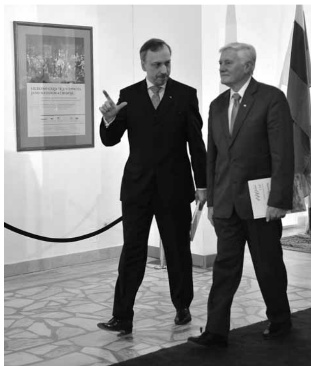
Parodos atidaryme dalyvavo parodos globėjas Lenkijos Respublikos kultūros ir nacionalinio paveldo ministras Bogdan Zdrojewski bei Lietuvos Respublikos prezidentas Valdas Adamkus.