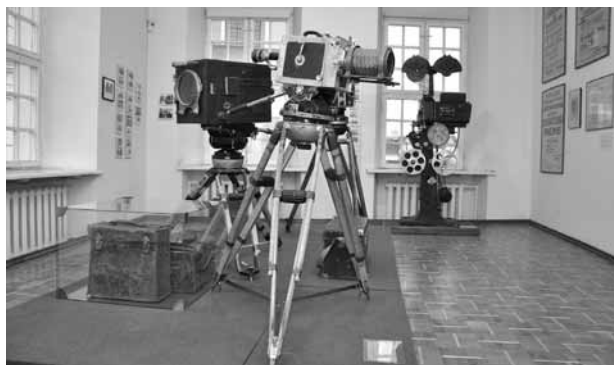
Lietuvos kino istorijos ekspozicija.

Mokslinės ekspertizės svarba labai didelė ir dėl tos priežasties, kad niekuomet anksčiau muziejuje nebuvo atliekami tokio pobūdžio tyrimai. Ištyrus, įvertinus bei pasinaudojus mokslininkų iš Norvegijos sukaupta patirtimi, pagerinus eksponatų kokybinį stovį, pagal galimybes pagerinus jų laikymo sąlygas, tiesiogiai naudos gavėjai būtų Lietuvos piliečiai, mokslininkai, muziejaininkai besirūpinantys ir besidomintys muziejuje saugomų eksponatų ilgaamžiškumu.