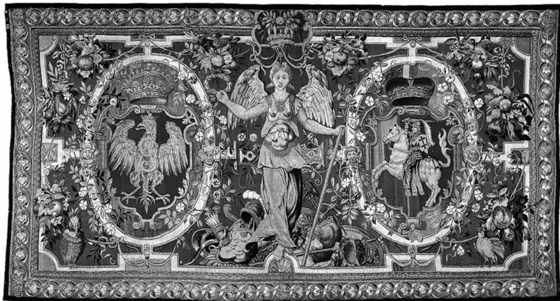
Žygimanto Augusto gobelenas su Lenkijos ir Lietuvos herbais bei Viktorijos figūra.

pilies ir katedros istoriją, unikalų paveldą, istorinius ryšius su Vilniaus rūmais, pilyje sukauptus muziejinius rinkinius. Tarp vertingiausių parodos akcentų buvo pasaulinio garso Žygimanto Augusto gobelenų kolekcijos audiniai, XVI–XVII a. puošę ir Vilniaus rūmus. Parodoje taip pat buvo galima pamatyti Lietuvos ir Lenkijos valdovų, didikų portretų rinkinį, medalių kolekciją, lobyno vertybes, koklius, ginklus, įvairius radinius ir kitus taikomosios dailės kūrinius bei unikalias lituanistines vertybes.