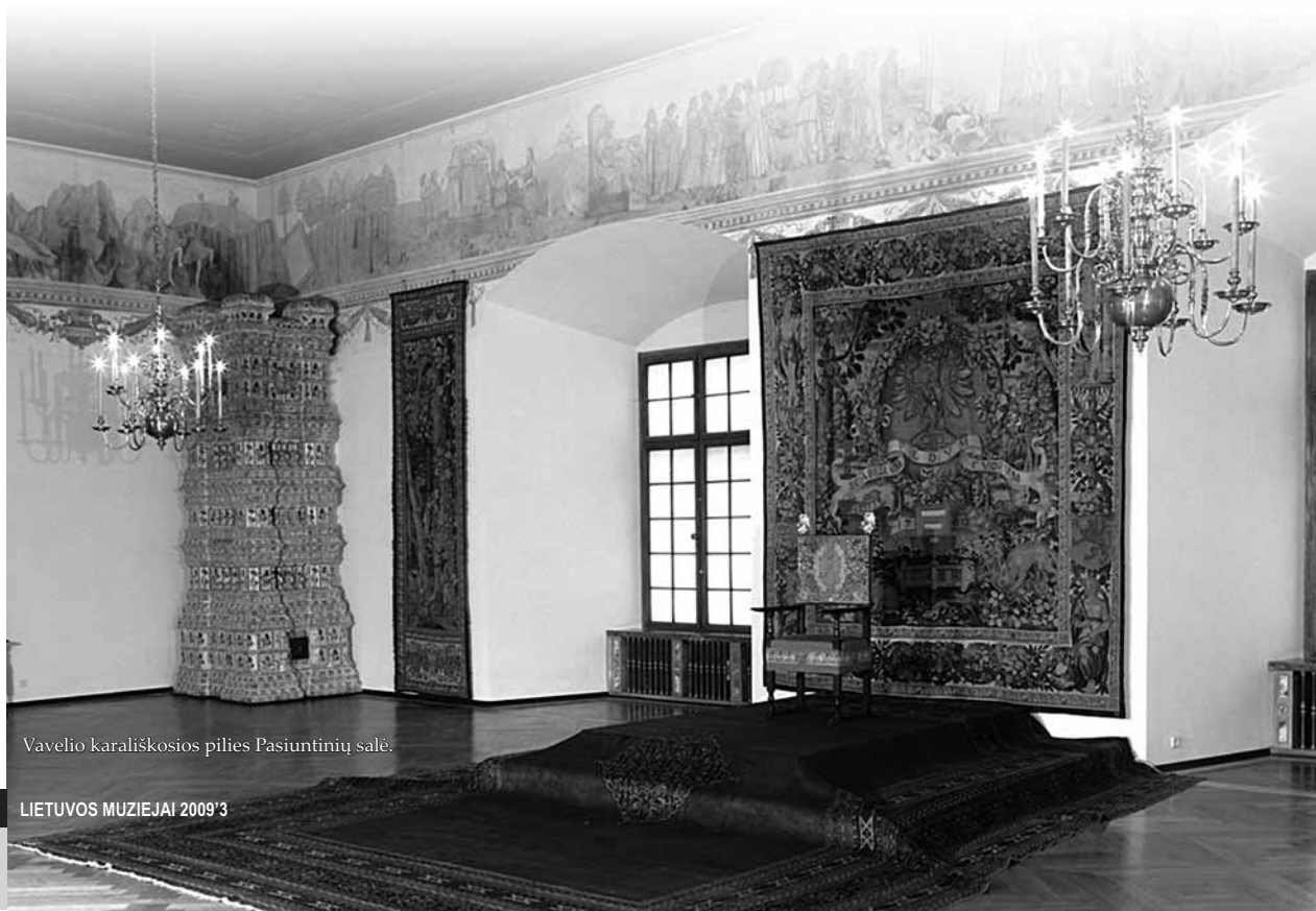
Vavelio karališkosios pilies Pasiuntinių salė.

Paskutinis, ketvirtasis, parodos skyrius vadinosi „Abiejų Tautų Respublikos bajorų kultūra“. Lenkų, lietuvių ir rusėnų politinė sandrauga leido bajorų sluoksnyje plėtotis bendrai ideologijai, susijusiai su sarmatizmu, formuotis panašiam gyvenimo būdai, meninei ir materialinei kultūrai. Vilniaus laikrodžiai, kilimai arba kontušinės juostos garsėjo visoje Abiejų Tautų Respublikoje, husarai buvo vienodai ginkluoti ir Lenkijoje, ir Lietuvoje. Lenkų ir lietuvių didikai šalies ir užsienio dirbtuvėse užsakydavo panašių meno dirbinių ir puošmenų bažnyčioms. Vakarinei ir šiaurinei Abiejų Tautų Respublikos dalims būdingas kultūrinis meninis reiškinys, neturintis atitikmenų kitose Europos šalyse. Tai karstų portretai ir skardinės lentelės. Šis reiškinys atsirado dėl Baroko laikotarpiu stipriai išplėtotu laidojimo apeigų. ■