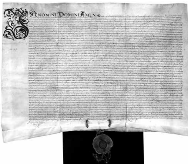
Lietuvos didžiojo kunigaikščio Žygimanto Augusto privilegija, patvirtinanti LDK bajorų teises ir laisves. Vilnius, 1547 m. vasario 14 d. (iš Vyriausiojo senųjų aktų archyvo Varšuvoje rinkinių).

Parodą Vilniuje organizavo Vavelio karališkoji pilis – Valstybiniai meno rinkiniai kartu su Lietuvos dailės muziejumi ir Nacionaliniu muziejumi Lietuvos Didžiosios Kunigaikštystės valdovų rūmais. Eksponatai, neįskaitant retų išimčių, yra iš Vavelio rinkinių. Jie suskirstyti į keturis skyrius. Pirmajame, kurio pavadinimas – „Jogailaičių Vavelis“, pateikti objektai, susiję su Jogailaičių, ypač su Žygimanto Senojo ir Žygimanto Augusto, meninės kūrybos veikla. Karališkoji pilis, kurią pradėjo statyti karalius Aleksandras Jogailaitis apie 1504 m., o tęsė ir užbaigė Žygimantas Senasis po 1540 m., čia pristatyta pasitelkiant