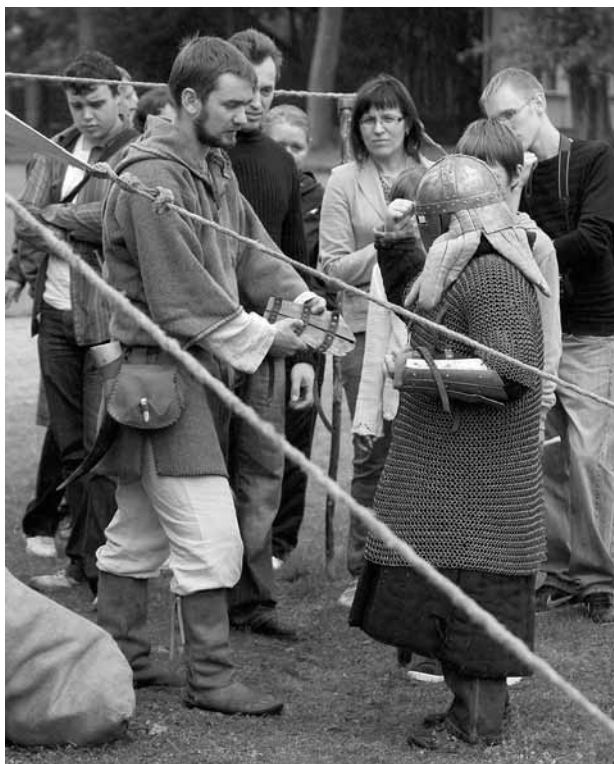
Gyvosios istorijos klubo „Varingis“ jauni barzdoti vyrukai rengė rokiškėnus šarvais ir vėliau surengė kovas su ginklais.