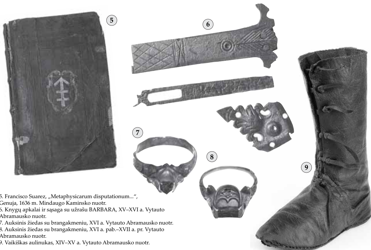
5. Francisco Suarez, „Metaphysicarum disputationum...“, Genuja, 1636 m.