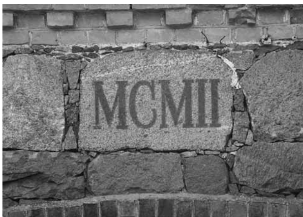
Įrašas virš malūno durų „MCMII“, liudijantis malūno iš medinio į akmens mūro perstatymą 1902 metais.

Pirmąsias žinias apie Liubovo dvarą kaip valdovo valdą teikia Žygimanto Augusto Vilniaus dvaro 1546 ir 1547 m. karališkosios sąskaitos Varšuvos Senujų aktų archyve.