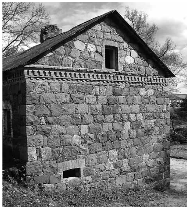
Taip atrodo Liubavo buvusio dvaro sodybos vandens malūnas dabar.