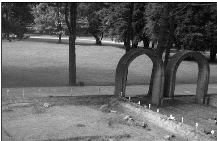
Ruošiamasi vieno didžiausių tvirtovės komplekso pastatų – arsenalo – atstatymo darbams: atliekami archeologiniai tyrimai

► Įgyvendinant projektą numatyta atlikti būtiniausias pilies rūmų renovacijos darbus: baigti tvirtinti pamatus (didžioji dalis pamatų jau buvo sutvirtinta 2007 m. valstybės ir savivaldybės lėšomis), atnaujinti pamatų hidroizoliaciją ir nuogrindą, sutvarkyti lietvamzdžius, atnaujinti pilies fasadus (sutvarkyti sienų ir skliautų įtrūkius, atstatyti fasado tinką, apie 3500 kv. m). Taip pat numatoma pakeisti dalį blogiausios būklės rūmų langų (rūsyje, III aukšte ir mansardoje, apie 100 kv. m) ir lauko duris, du langus numatyta papuošti dekoratyviniais vitražais. Durys ir langai bus keičiami kokybiškesniais, artimesniais to meto autentiškiems pavyzdžiams gaminiams.