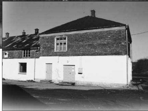
Vytėnų saleziečių vienuolyno ansamblis.