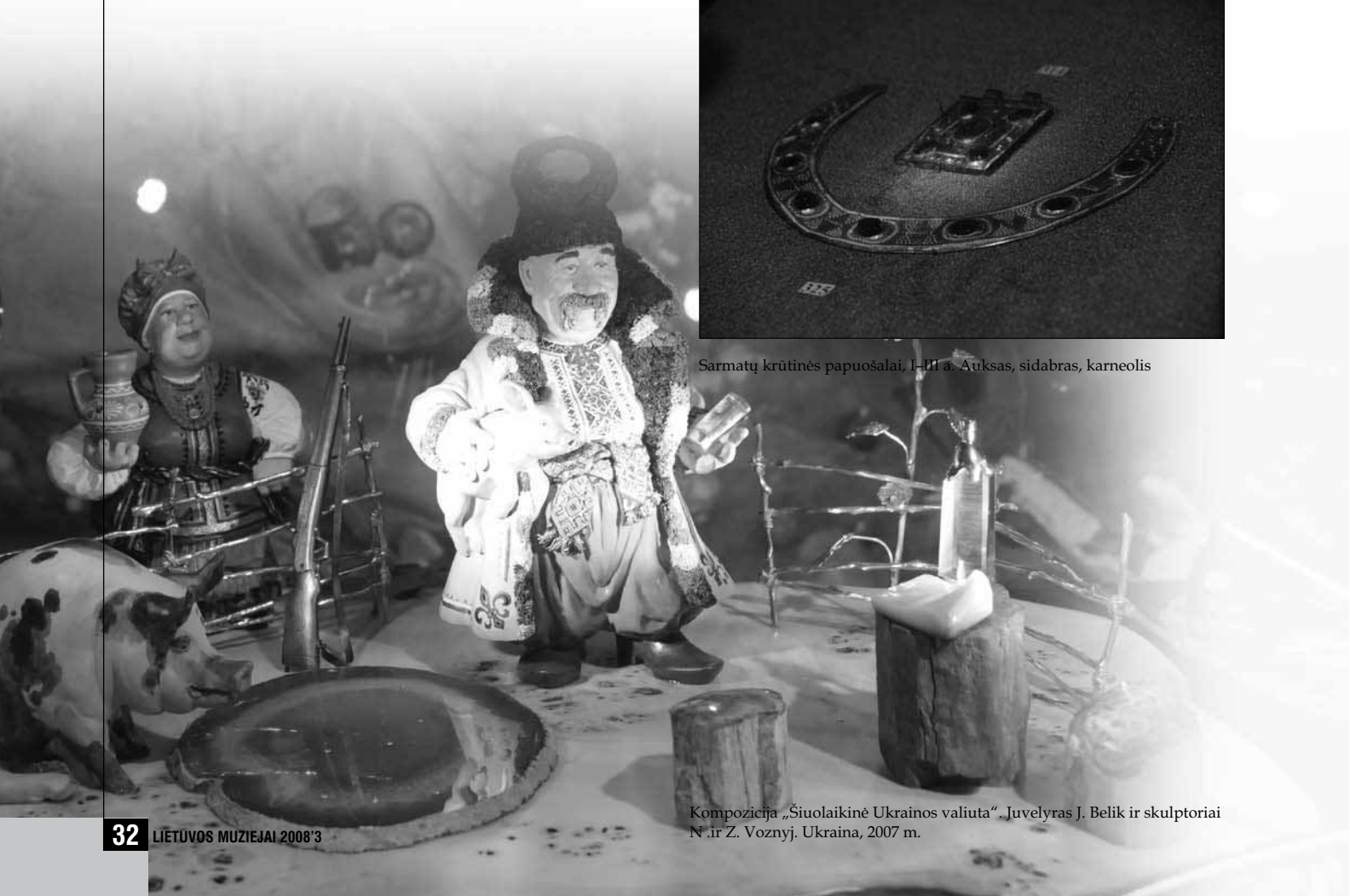
Kompozicija „Šiuolaikinė Ukrainos valiuta“. Juvelyras J. Belik ir skulptoriai N. ir Z. Voznyj. Ukraina, 2007 m.