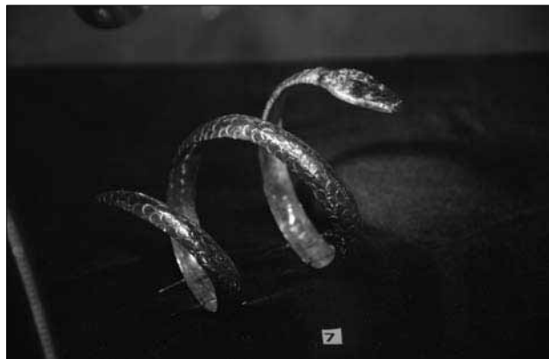
Skitų gyvatės formos apyrankė, IV a. pr. Kr.