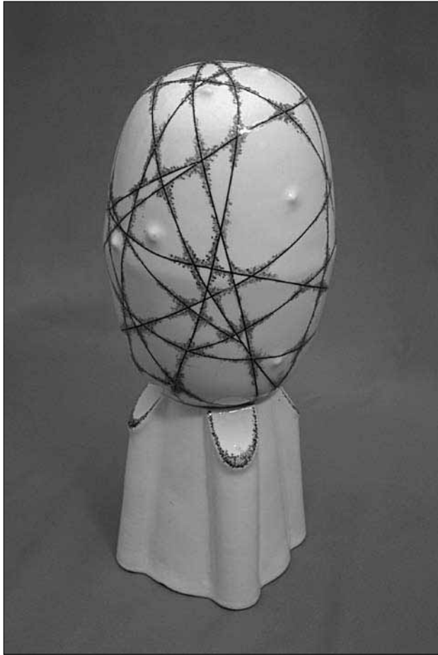
L. Šulgaitė. „Augalas 1“. 2003 m.

eksperimentų. Atrasti įvairūs gruntai, suteikiantys skirtingus dažo išsiliejimo efektus. Kartais naudoja popieriaus masės reljefą. Paviekslai gimsta iš jautriai pastebėtų akimirkų gamtoje – tai ištisi ciklai senamiesčio grindinio, upės vandens raibuliavimo, metų laikų kaitos arba filosofinės laiko, smėlio laikrodžių temos. Paviekslai lakoniški ir subtiliai elegantiški.