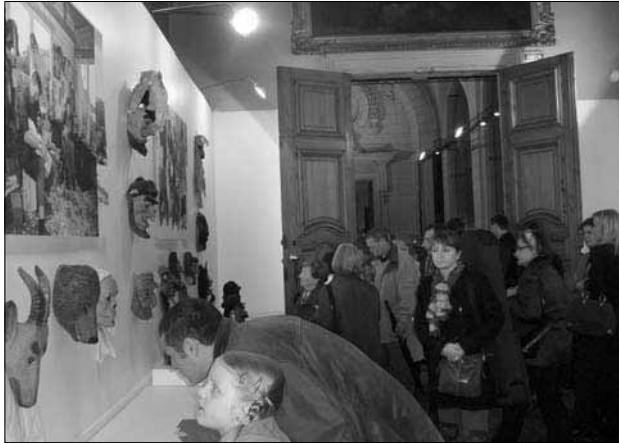
Perigueux miesto gyventojai apžiūri parodą