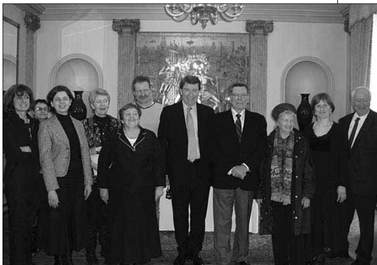
Kretingos muziejaus delegacijos priėmimas pas Perigueux miesto merą Xavier Darcos

K retingos muziejaus fonduose saugomas itin unikalus liaudies meno kūrybos lobis – 52 Užgavėnių kaukės (ličynos). Kiekviena jų – išskirtinė, atspindinti XIX a. pab.–XX a. pr. visai Žemaitijai būdingus Užgavėnių kaukių personažus: „Morę“, „Raganą“, „Gervę“, „Ožką“, „Giltinę“ ir t. t. Muziejaus kolekcija itin vertinga etnokultūros tyrinėtojams, liaudies tradicijų specialistams, užsienio šalių liaudies meno žinovams. Užsimezgdus kultūrinio bendradarbiavimo ryšiams su Perigueux (Perigoro) miesto bendruomene šia kolekcija ypač susidomėjo prancūzai.