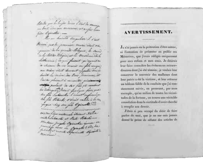
M. K. Oginskio 1826–1827 m. išleistų „Atsiminimų“ I tomo papildymų fragmentas

► 1810 m. M. K. Oginskis buvo paskirtas caro slaptuoju patarėju. Vienu metu jis buvo tapęs ir prorusiškos Lietuvos politikos šali-