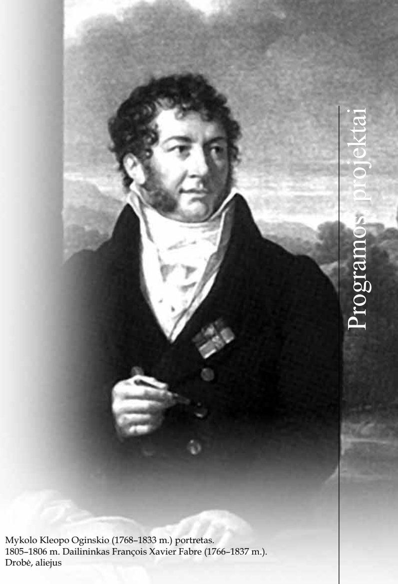
Mykolo Kleopo Oginskio (1768–1833 m.) portretas. 1805–1806 m. Dailininkas François Xavier Fabre (1766–1837 m.). Drobė, aliejus

Įgyvendinant programą Žemaitijoje 2006 m. pradėti rengti tarptautiniai Mykolo Oginskio muzikos festivaliai. Nuo 2005 m. Rietavo muziejuje surengtos trys mokslinės konferencijos „Kunigaikščių Oginskių politinė, kultūrinė veikla: praeities refleksijos, ateities perspektyvos“. Tais pačiais metais trijų