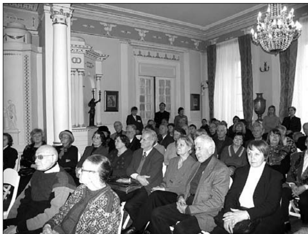
Parodos „Amžinieji keleiviai“ atidarymo momentas