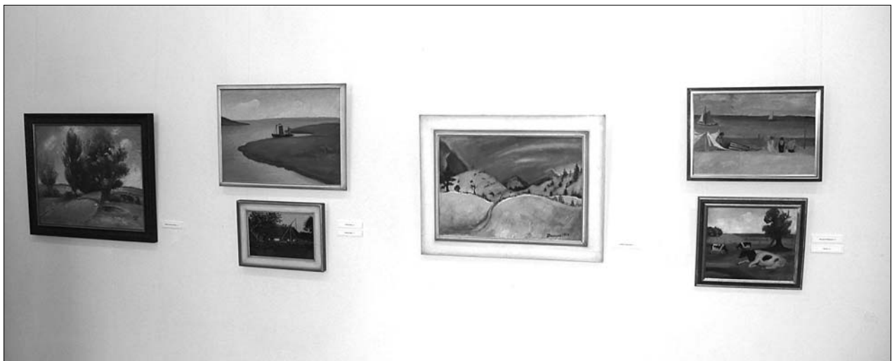
Parodos „Amžinieji keleiviai“ ekspozicijos fragmentas